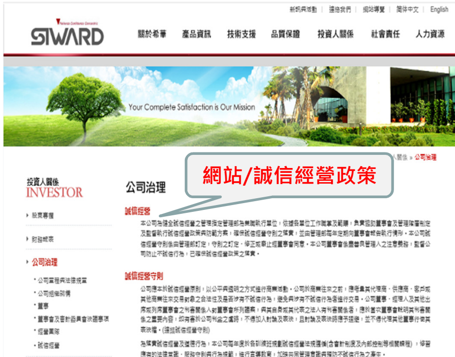
(六) 履行誠信經營情形及與上市上櫃公司誠