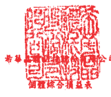
民國一〇三年及一〇二年一月一日至十二月三十一日