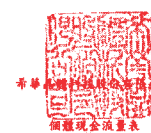
民國一〇三年及一〇二年一月一日至十二月三十一日